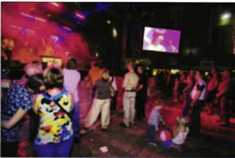
De overtuiging van de draaiende cijfers en de laatste editie van het Booch?-festival in het centrum van Heerlen.

Weeromstandigheden. In meer en meer wordt de organisatie van Booch? een vraagstuk. De redactie is dat de organisatie van Booch? een vraagstuk. De redactie is dat de organisatie van Booch? een vraagstuk. De redactie is dat de organisatie van Booch? een vraagstuk.