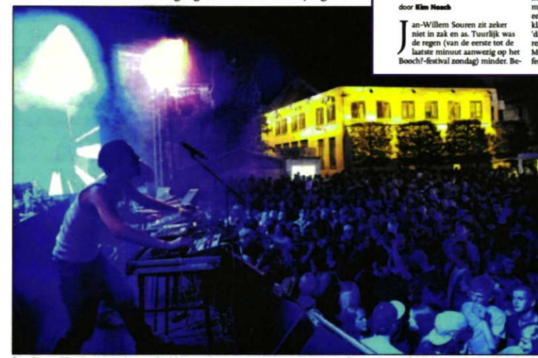
Zaterdagavond konden de bezoekers van Booch? nog genieten van een aangename temperatuur. Gisteren bleven velen thuis.

BOOCH? Frans Timmermans gaf gisteren advies over jeugdwerkloosheid