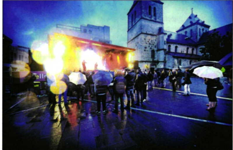
Bezoekers van Booch? op zondag moesten vele liters water trotseren om optredens - zoals hier op het Pancratiusplein - te zien.

BOOCH? Door de continue plensbuien op zondag duikt Booch? 10.000 euro het rood in